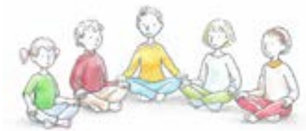
L'équipe du RYE

Bonne fin d'année scolaire à toutes et tous !